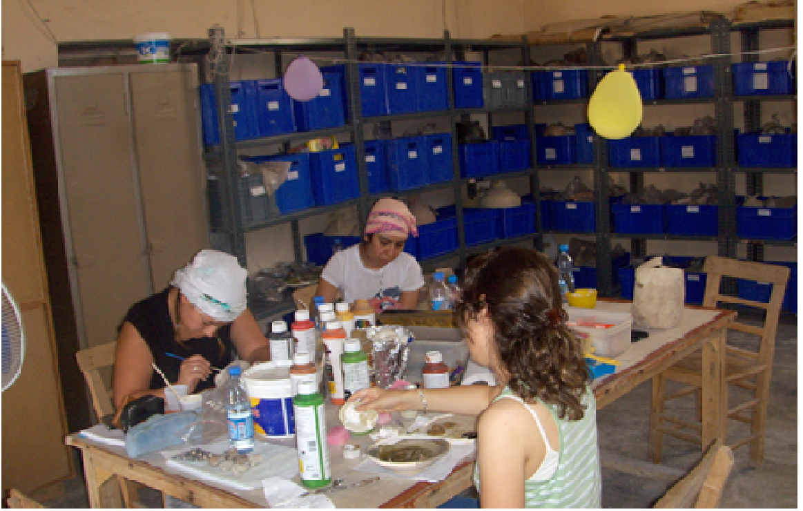
Resim 2: Hasankeyf Kazı Evi laboratuvarında uygulamalı ders takibi.