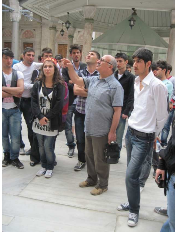
Resim 6: Taşınmaz kültür varlıklarının