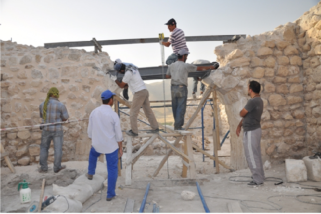
Resim 4: Hasankeyf Büyük Saray Restorasyonu, uygulamalı ders yapımı.