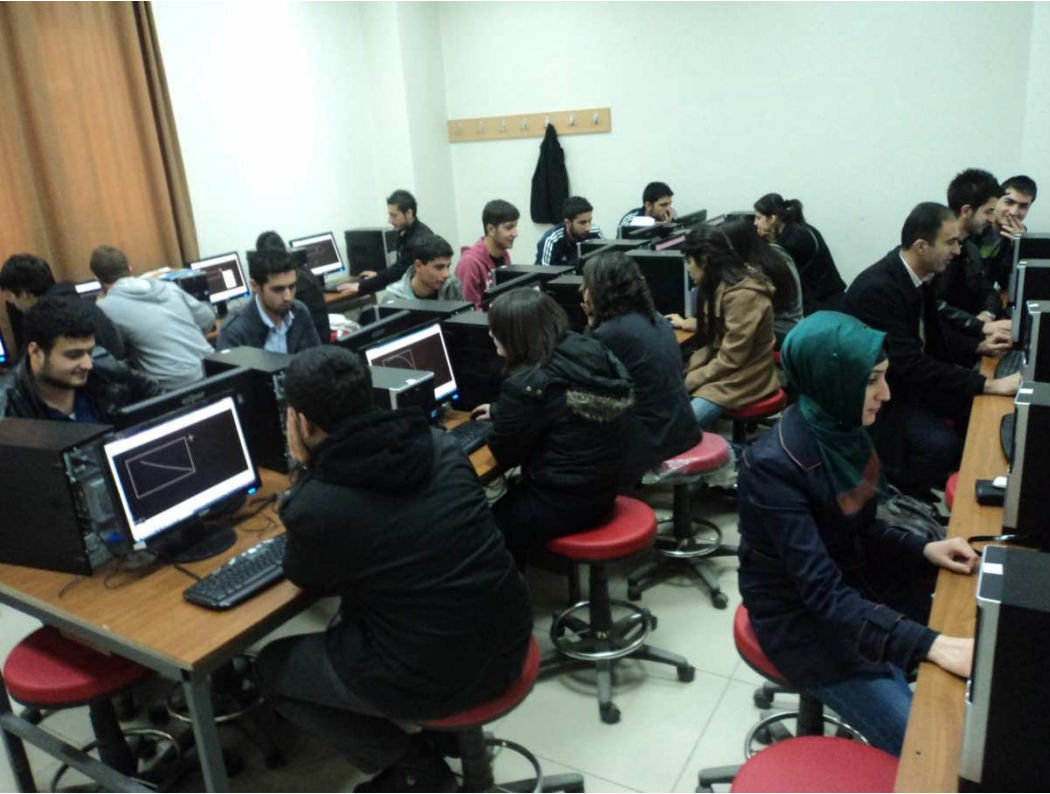
Resim 5: Bilgisayar destekli ders yapımı.