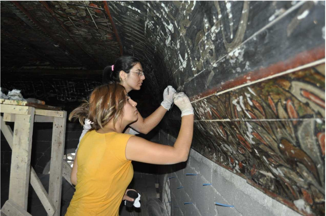
Resim 3: Diyarbakır Ulu Camii Restorasyonu, uygulamalı ders yapımı.