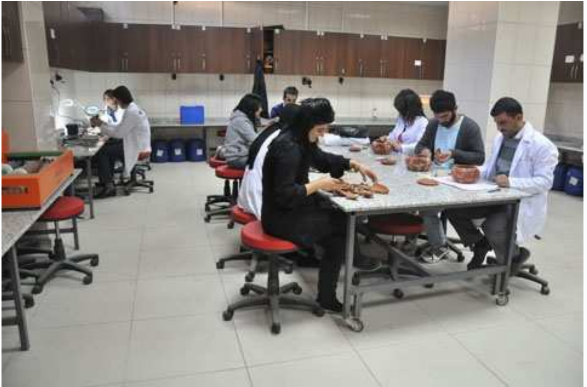
Resim 1: Bölüm laboratuvarında uygulamalı ders yapımı